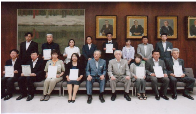
第35回 ニッセイ財団 贈呈式 H25. 7. 12 (於秋田県庁)

午後2時50分から50分間、時間いっぱい踊りました。「高原列車は行く」「一元玉の旅がらす」。歌や手遊びでも盛り上がりました。